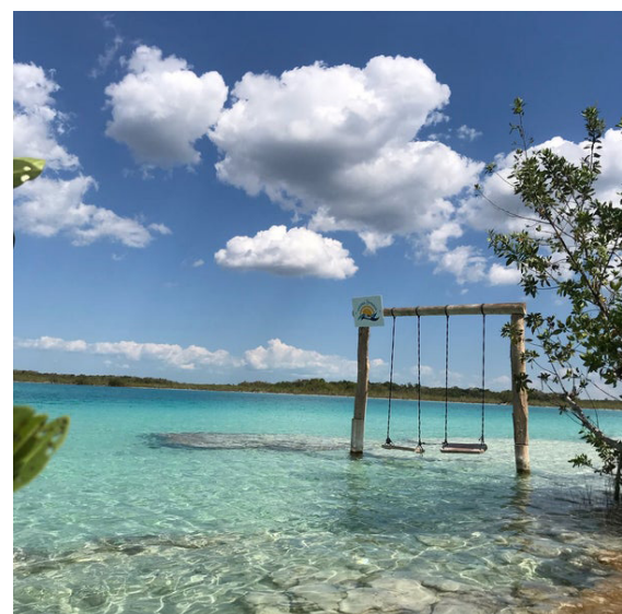
Laguna de Bacalar, Quintana Roo, México

En la actualidad, los palafitos o villas flotantes se han convertido en espacios de alto lujo turístico, principalmente en zonas del medio oriente (Thailandia) o islas del continente de Oceanía (Polinesia), por su contexto marítimo, aguas tranquilas y de bajo oleaje. Actualmente, Latinoamérica está pretendiendo traer esa cultura oriental post moderna y aumentar su turismo de alto estatus, aprovechando sus playas, principalmente en el área del Caribe.