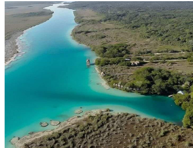
Laguna Bonanza, Quintana Roo, México