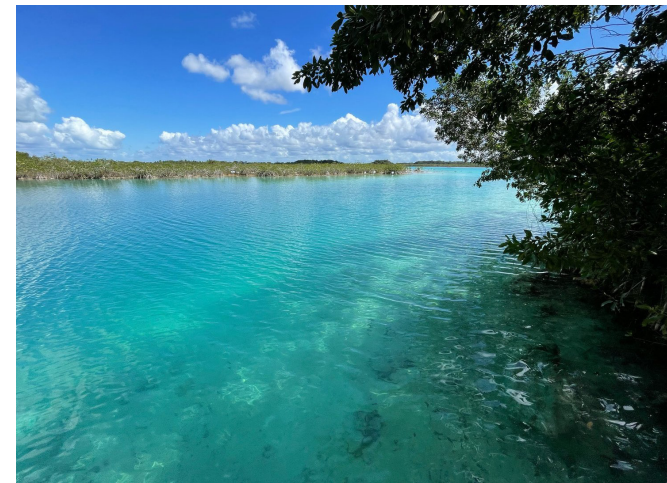
Laguna Bonanza, Quintana Roo, México

Su clima es tropical gran parte del año y caluroso en verano, suele presentar lluvias esporádicas en los meses de junio a septiembre.