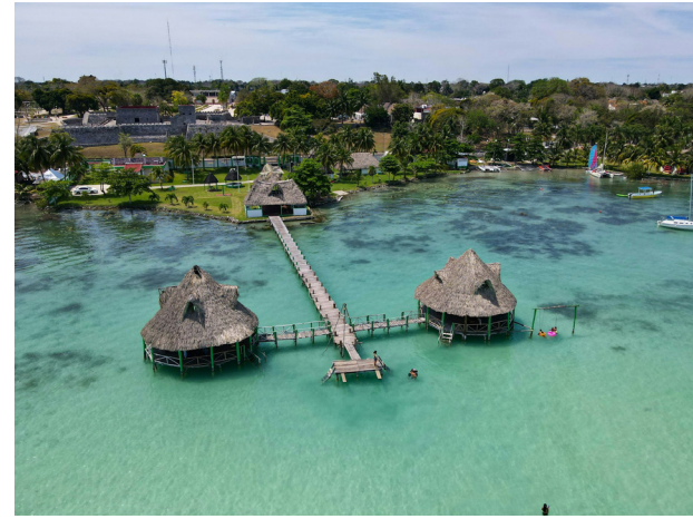
Viajeros reposando en bungalows o palafitos.

Para la concepción del prototipo es fundamental comprender lo especial que es el lugar y respetar al máximo la naturaleza existente. Por dichas razones se pretende que el diseño se integre al contexto, sea de bajo impacto y en todo momento se deberá priorizar el paisaje natural.